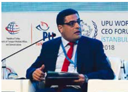
АБДЕЛЬКАРИМ ДАХМАНИ, Генеральный директор почтовой службы Алжира

Совет, который я дал бы странам-членам ВПС, заключается в том, что нужно постараться гармонично сочетать экономическое развитие и понятие государственной услуги, носящей универсальный характер. Важно и то и другое. Бизнес ради бизнеса может быть и хорош, но нельзя игнорировать более широкую миссию почтовой услуги – служить гражданам страны. В некоторых странах люди, живущие в отдаленных районах, не имеют доступа к различным услугам, и почта играет ключевую роль в сплочении общества. Я считаю, что почта занимает важное место в оказании социальной помощи во всех странах.