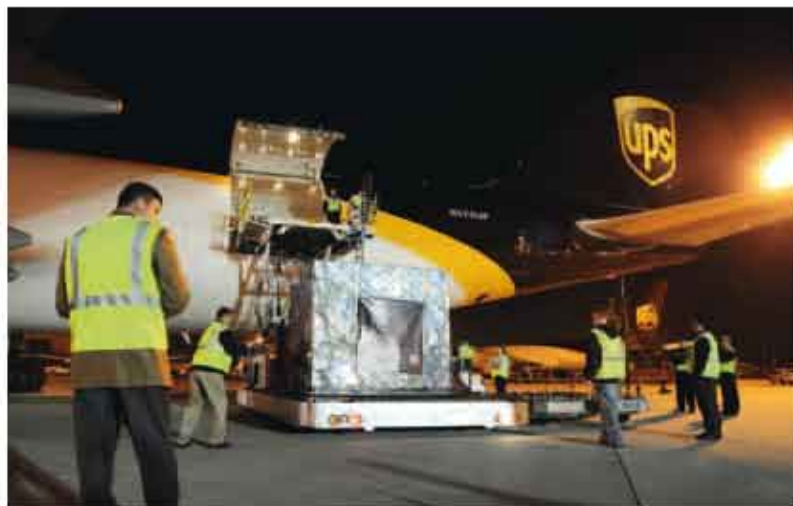
在私营快递公司UPS的一架飞机上发现邮件物品，引发美国运输安全管理局出台各项措施 图A: Gettyimages

2011年4月，万国邮联新成立的委员会间的安全小组，由邮政经营者和国际组织组成，第一次召开会议商讨全球邮政安全标准的制订以维护全球供应链的安全。