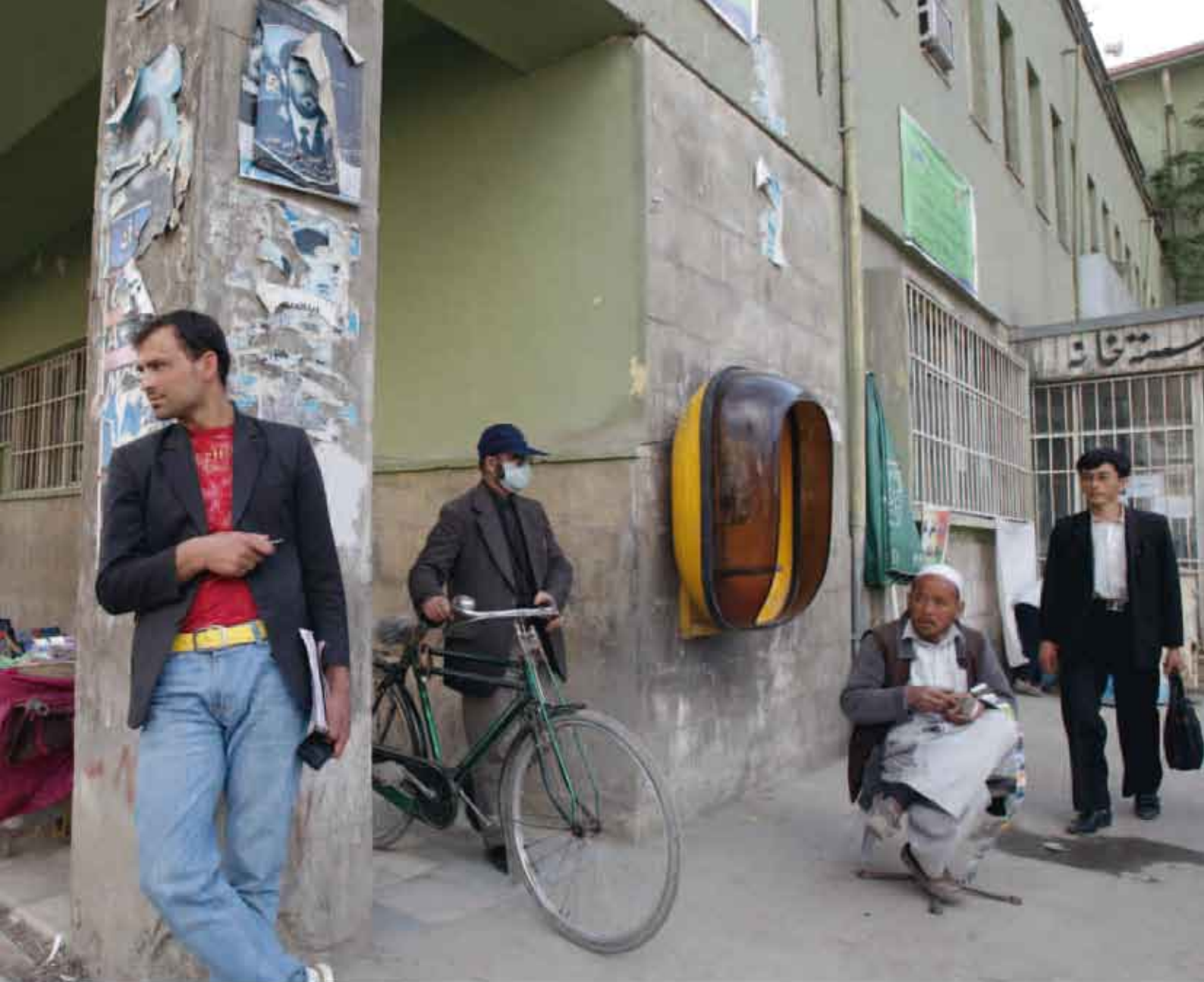
2011年4月喀布尔普什图恩斯坦广场附近街景

了培训，并在电脑上安装了相关数据库。在启动项目前，我们打电话、写信通知省会城市的所有主要邮局，告诉他们如何在电脑中插入邮政编码。