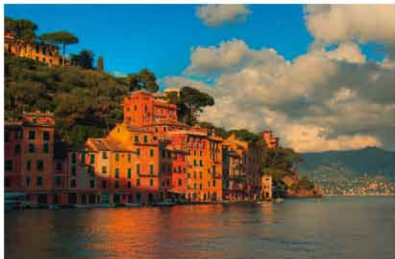
新区域性邮联将保护其成员的利益

来自欧洲和阿拉伯地区的13个邮政共同建立了万国邮联的第17个区域性邮联——地中海地区邮政联盟。区域性邮联总部设在意大利首都罗马，成员包括塞浦路斯、埃及、法国、希腊、意大利、约旦、黎巴嫩、马耳他、摩纳哥、巴勒斯坦、斯洛文尼亚、叙利亚和土耳其。