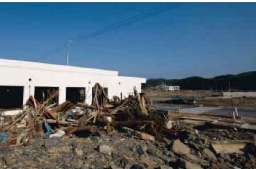
位于南三陆町志津川的邮局