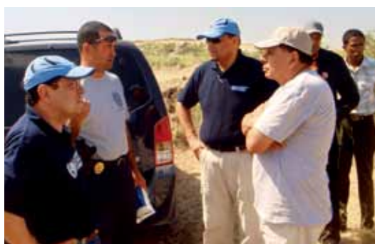
万国邮联代表和联合国邮政观察员 2 月首次考察海地。