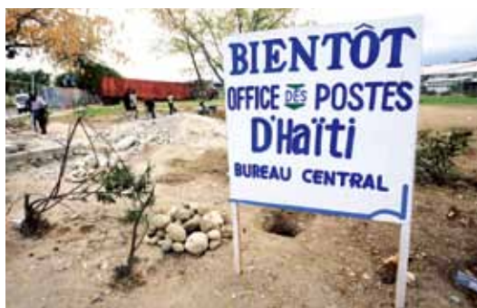
新邮局地址设在 SONAPI 工业园区。