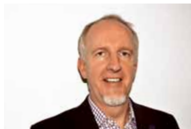
万国邮联电子商务负责人Paul Donohoe

我的目的是，继续为所有的管理部门、个人和企业做一个值得信赖的第三方，如果用户对使用电子通信深信不疑，我就要为他服务。电子业务可以增值。想象一下，在电子形式下，如果你能够真正认证一封信的寄信人、收信人和内容，并能用数字工具保护诸如数字签名等内容，以验证这正是Sarmi签发的文件，这将是何等美妙。