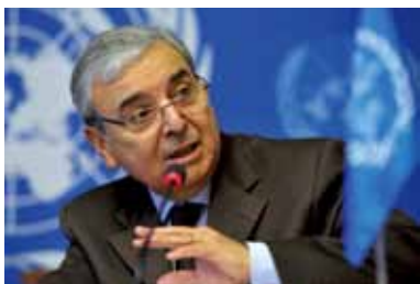
万国邮联总局长爱德华·达扬

在金融危机中所传达的重要信息就是消费者不信任金融机构。我们观察到，许多人从银行里把钱取出来再存到邮政机构里，当涉及信任时，邮政有良好的形象。为什么万国邮联决定上马“.post”项目呢？是因为我们具有专家地位，我们的网络迅速扩展，因而在开发业务方面我们现在有远见、有战略、有能力。