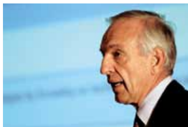
意大利邮政首席执行官Massimo Sarmi

我们的目的是创建一个完全融合的三维网络：实物、电子和金融。在互联网上，你可以在世界各地订货，但你能够通过互联网收到货物吗？不能。我们确保物流网络到位，这样你的货物就可以发运了。信任在互联网上是个问题，但在“.post”上不是问题。我们将拥有邮政行业的专用空间，这里是绝对安全的，在这种环境中，我们能够识别所有的参与者。