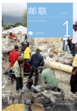
封面：海地太子港 Sophia Paris 快递邮件业务大厦