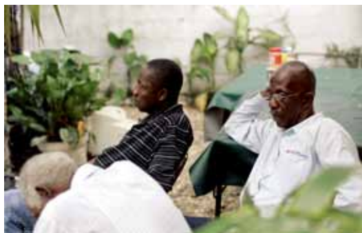
这些无家可归的邮政员工也住在 Emile 院子的帐篷内。