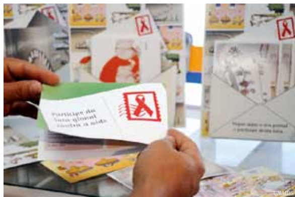
大约800 000个家庭将收到资料。

这项全球范围的活动已经在布基纳法索、喀麦隆、中国、爱沙尼亚、马里和尼日利亚展开，其他合作伙伴包括国际劳工组织和UNI全球联盟。活动旨在通过邮政网络的66万个邮局宣传艾滋病的防控知识。FM