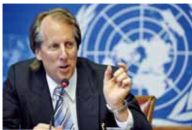
..... 互联网名称与数字地址分配机构总裁 Rod Beckstrom

今天是全球网络虚拟世界与现实世界相拥的历史性时刻。几百年来，邮政一直在为这个星球上的人们之间传递信息，万国邮联是全球的领跑者，把所有这一切成功地融合在了一起。互联网名称与数字地址分配机构帮助人们在互联网上做同样的事情，作为所有互联网名称与数字地址的全球管理和决策机构，互联网名称与数字地址分配机构促成人们在虚拟世界里的相互连接。在联合宣布“.post”顶级域名中，最动人之处在于与万国邮联的合作机遇，它把这两个世界融合在了一起，可以期待创意非凡的各成员国的创新。