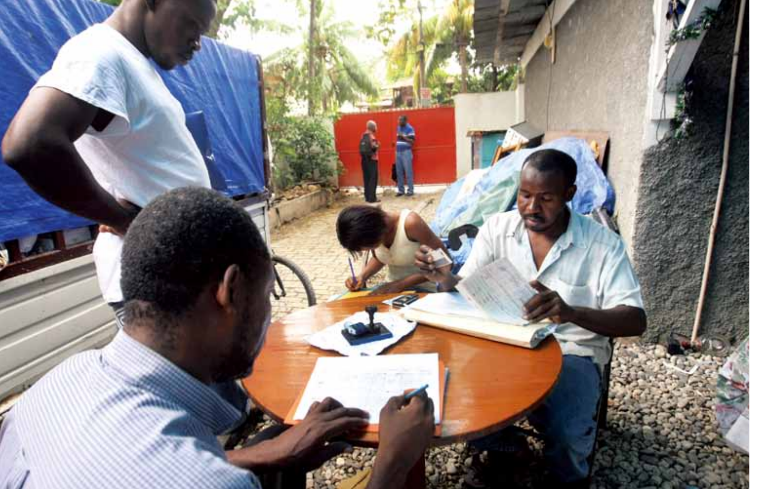
邮政员工在总局长的住处为人们提供基本业务，如出售邮票。在他们旁边，是一辆盖着防雨布的装满邮件的卡车。

一个价值 30 万美元的紧急救援项目，以便向这个加勒比国家派出国际邮政专家，并可以购买更多必要的邮政设备和车辆，以帮助海地邮政重振旗鼓。海地邮政需要各种用品，如工作台、分拣台、架子、袋子、投递员背包和电池。捐赠物资的发放将通过万国邮联的兄弟机构联合国开发计划署进行。