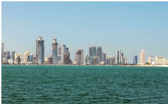
多哈，2012年第25届万国邮政大会会址

5 月初，万国邮联惊悉 Cheikh Al-Thani 在 4 月 30 日的一次车祸中不幸逝世，年仅 40 岁。