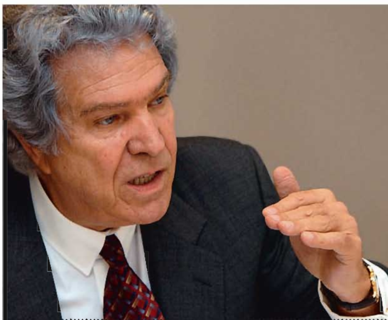
巴西交通部长Hélio Costa