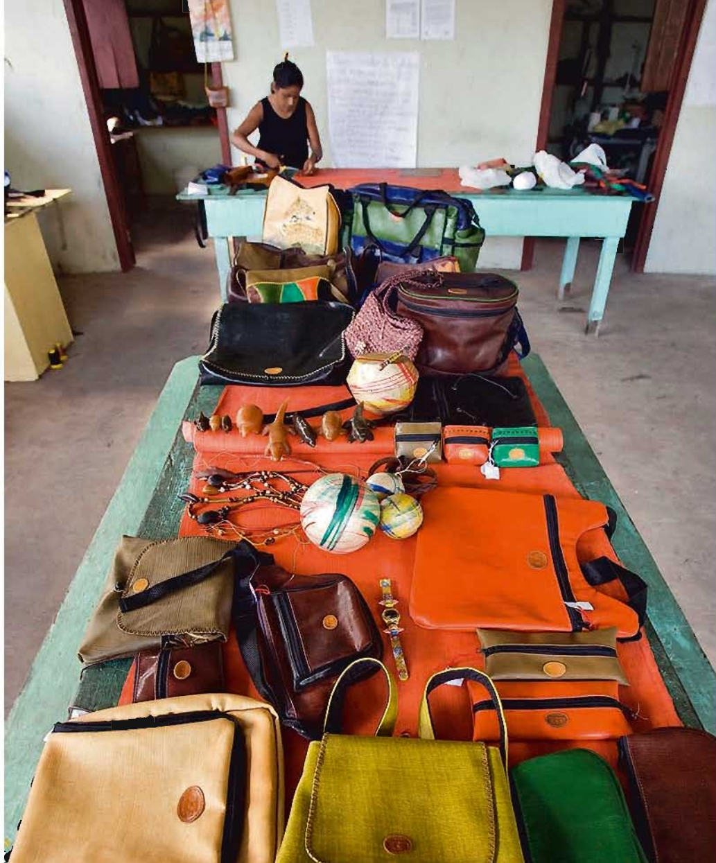
请帮我把包裹从巴西出口。