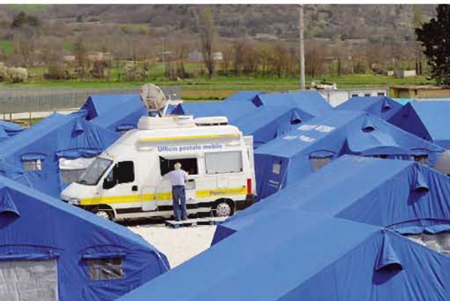
在阿基拉，灾民得到移动邮局的帮助

在澳大利亚的一个接待中心，在救灾工作中，邮政员工表现出了奉献精神并发挥了对当地环境熟悉的优势。“许多居住在该地区的员工都自发过来帮助分拣和看护邮件，