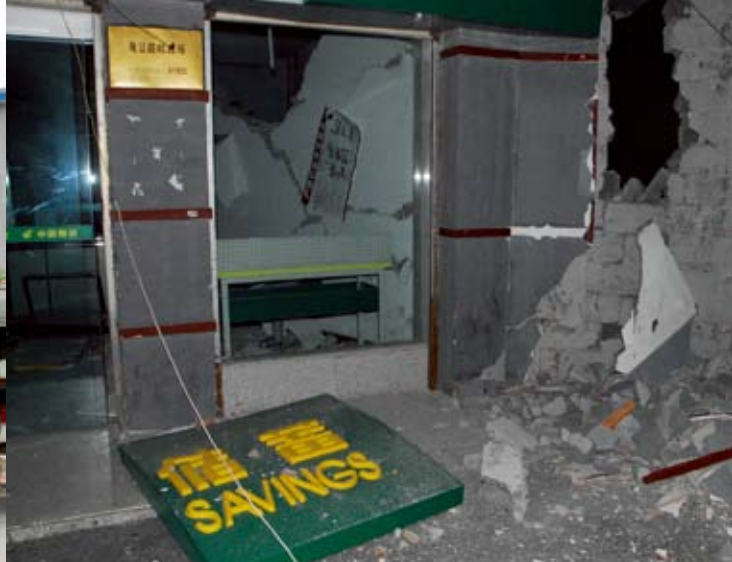
都江堰市的一个邮局

各快递企业也积极投入援助工作：SF 速递公司共捐款 130 万美元；ZJS 快递公司向灾区提供物资保障车辆，DHL 公司的 3 家中国公司 (Sinotrans、Global Forwarding 和 Exel Supply Chain) 共捐款 14.5 万美元，由国际电信联盟组织的援助活动中，瑞士 FedEx 公司免费提供卫星传输设备，使得灾区的通信链路得以恢复。从美国和香港的 UPS 公司运出数吨食品和药品以及 10 000 多顶帐篷、1100 张行军床和医疗设备。