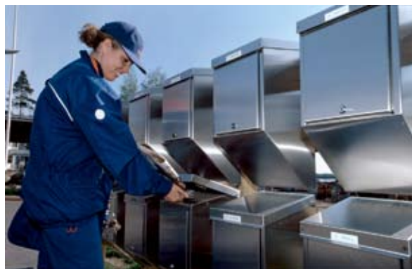
“邮政改革发展综合计划”是长期改革的坚实基础。

合计划”记录下来的情况，国家要求，公共事业部门及其下属企业的邮件不再由这些部门自己的机构来运递，而应由指定的运营机构来运递，过去的一些做法曾削弱了指定运营机构的力量，妨碍了开展邮政普遍服务。此外，哥斯达黎加邮政同巴西邮政签署了一项协议来发展运营机构。在万国邮联的协同支持下，在一年时间内，对指定运营机构的工作程序又复查了一遍。在好几个地区，业务质量获得了提高（从原来的4天缩短到1天）。通过“改进业务质量基金”的努力，哥斯达黎加已经进行了分区管理，以便实施地址编写系统来改进投递业务质量并发展混合邮件业务。除了获得“改进业务质量基金”的资助外，“邮政改革发展综合计划”还得到哥斯达黎加政府、美西葡邮联和中美洲经济整合银行（BCIE）的资助。