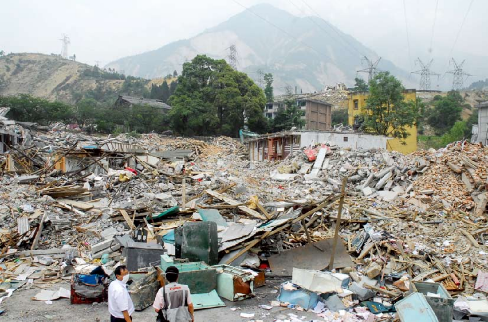
映秀镇邮局的废墟