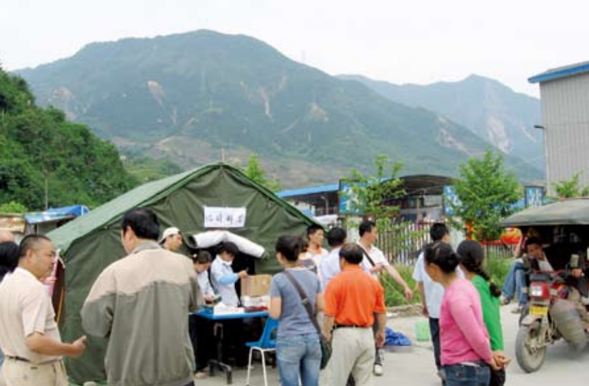
迅速建立临时邮局