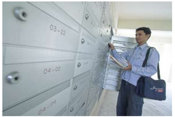
编写标准的地址将改进邮件投递、降低处理费用、提高收入。

未投递仍要付费。这方面没有什么规则，每一个国家均按自己的方式办理。他在这本书中向商业信函专家提供了按国家介绍了地址编写的特征，对万国邮联在这一领域进行标准化工作做出了贡献。